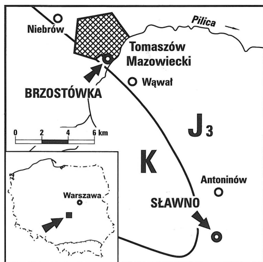
Fig. 1. Lokalizacja profili (Brzostówka, Sławno) zawierających serpulity tytonu/wołgu na pograniczu sekwencji jurajskiej (J3) oraz kredowej (K) w synklinie tomaszowskiej, na północno-zachodnim krańcu mezozoicznego obrzeżenia Gór Świętokrzyskich (adoptowane z: Kutek 1994, fig. 1B).